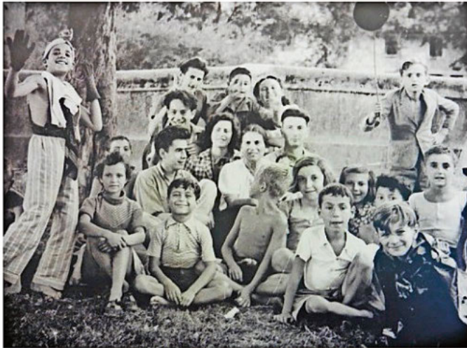
Kinder von Izieu - von den Nazis in Auschwitz ermordet http://www.friedensrat.org/pages/aktionen/friedensrat-auf-tour/die-kinder-von-izieu.php

Internationaler Tag des Gedenkens an die Opfer des Nationalsozialismus Entschieden handeln gegen rechts!