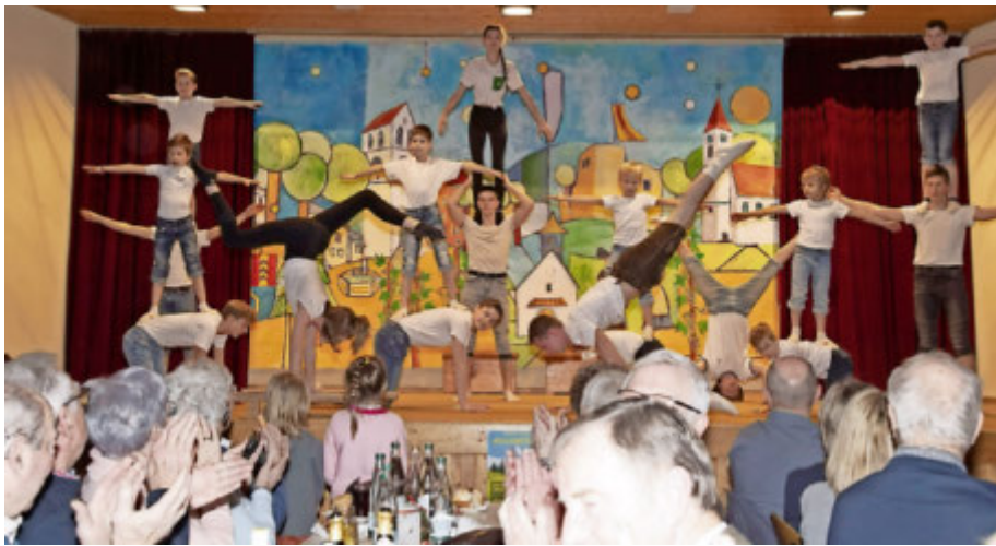
Akrobatik vom Turnernachwuchs

funden hat. Unter einer „Textildemenz“ litt wohl eine Britzingerin, die in der Nacht während des Winterfestes wegen der herrschenden Hitze splitternackt in den Dorfbrunnen gesprungen war, dann ihre Klamotten vergessen hatte und so, wie sie Gott geschaffen hatte, den Heimweg quer durchs Dorf angetreten war. Viel Freude hatten die „Putzwiber“ auch am Hausmeister der Neuenfellschule, der wegen seiner „umweltbewussten Sparmaßnahmen“ aufgefallen war. Er habe wohl, so die beiden Frauen, den genauen Papierverbrauch der Gäste des vergange-