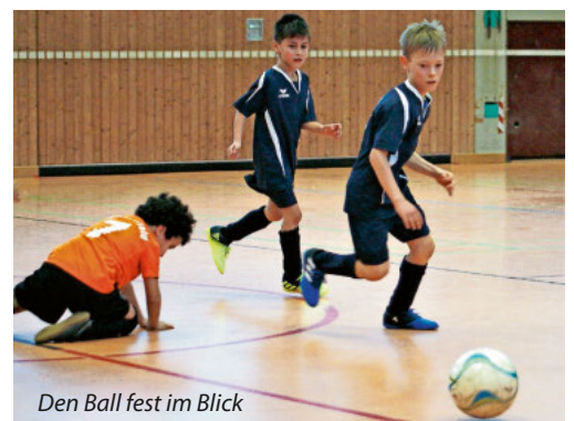
Den Ball fest im Blick

Ein Dankeschön an alle fleißigen Helferinnen und Helfer, die unermüdlich Brezeln, Sandwiches und Wienerle unter das hungrige Volk brachten.