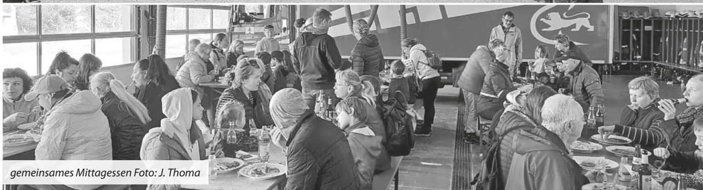
gemeinsames Mittagessen