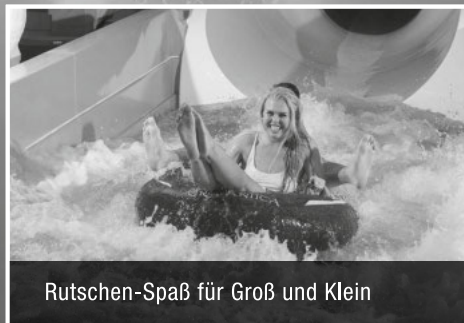
Rutschen-Spaß für Groß und Klein